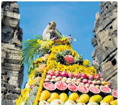
विश्व-व्यापनभासमा सांस्कृतिक इन्ड्रेजी