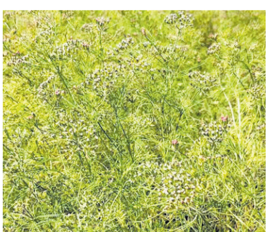
हेलम्बुमा फलन थाल्यो जिआ - पृष्ठ ७