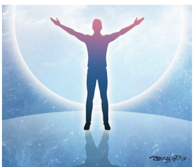
कहाँ छ मुक्तिको मार्ग ? - पृष्ठ ५