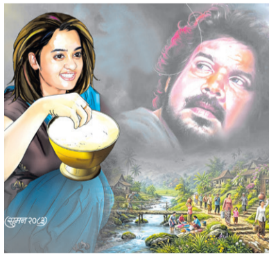
एक कचौरा करुणा - पृष्ठ ५