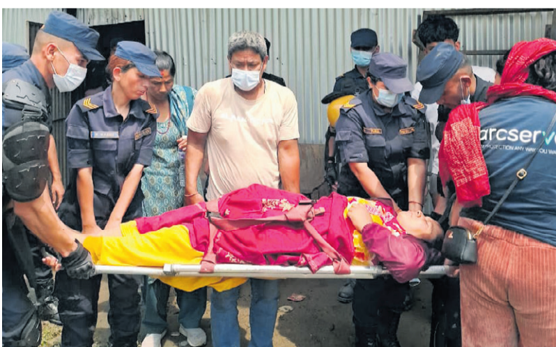
थापाथलीस्थित बागमती नदीकिनारको सुकुम्बासी बस्ती हटाउने क्रममा बेहेस महिलालाई अस्पताल लैजान सहयोग गर्दै प्रहरी।