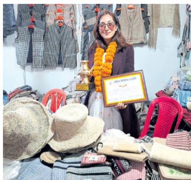
अल्लोवाली 'हिसिला दिदी' - पृष्ठ ७