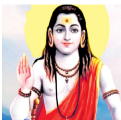
अमर योगी, अखण्ड ज्योति - पृष्ठ ३