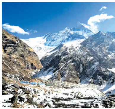
अन्नपूर्णा : शिखरको दिव्य वात्सल्य - पृष्ठ ४